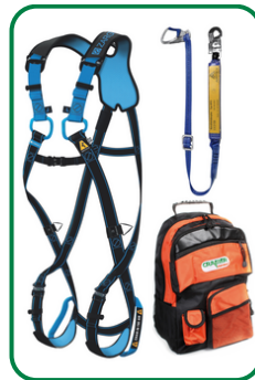
Set 2 - Komfort Auffanggurt Salvex+, Verbindungsmittel mit BFD, Rucksack