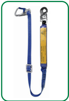
Verbindungsmittel mit Bandfalldämpfer

einstellbar bis 1,80 m gem. DIN EN 354 + 355 + DIN 19427