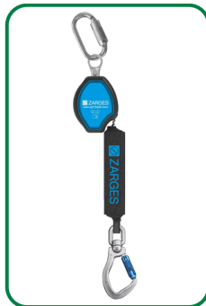
Höhensicherungs- gerät Aethor 1.8

Seilzug bis 1,80 m gem. DIN EN 360 + DIN 19427