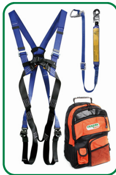
Set 1 - Standard Auffanggurt AX 20 C, Verbindungsmittel mit BFD, Rucksack