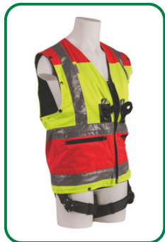
Fahrer Weste mit Auffanggurt