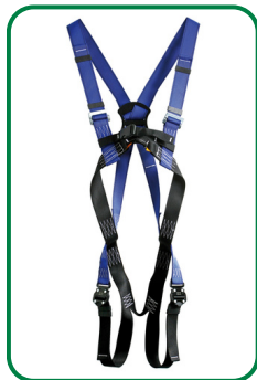
Auffanggurt AX 20 C

Persönliche Schutzausrüstung gegen Absturz